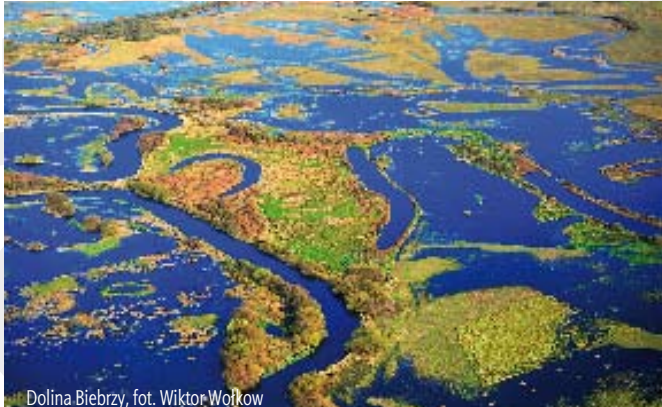
Dolina Biebrzy

Śląski Zamek Sztuki i Przedsiębiorczości serdecznie zaprasza 10 sierpnia o godzinie 17.00 na wernisaż wystawy fotograficznej „Dzika Polska” . Kolekcja zdjęć przedstawia najdziksze, najcenniejsze i najbardziej naturalne obszary Polski; pokazuje te miejsca, które jeszcze nie zostały przekształcone lub zniszczone.